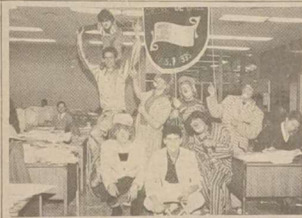
Una comitiva de payasos y de equilibristas llegó hasta LA TERCERA, para contar las actividades de aniversario del Sindicato Circense de Chile.

El día de hoy los payasos lo dedicarán a la solidaridad social y a recordar a sus colegas que ya no están en este mundo. En lo primero, irán a las 10 horas a los albergues de Santiago para entregar sana alegría a los damnificados, que de seguro se estimularán por esta ayuda de risa. Por la tarde, a las 15 horas, realizarán una romería al mausoleo circense, donde se hará una misa de campaña oficiada por el padre Grego-